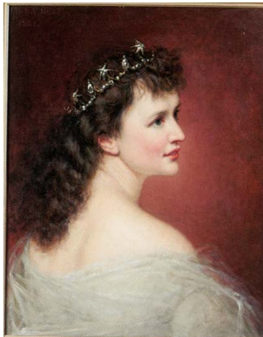
Fig. 11. Regina Elisabeta cu tiară. Ulei pe pânză. Semnata și dataată stânga sus, cu negru: „G.P.A. Healy. 1881”. 67,7 cm × 51,5 cm. După o fotografie de Franz Mandy de la 1870. Colecție particulară, Germania. Fotografia a fost reprodușă după catalogul expoziției Carmen Sylva. Eine Königin aus Neuwied , Museum. Neuwied, 2016.