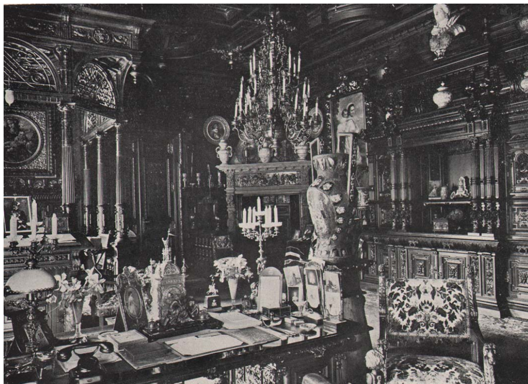
Fig. 8. Reproducere fotografică după Cabinetul de lucru al Regelui Carol I cu portretul lui Healy, 1933.