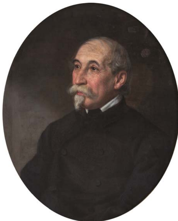
Fig. 3. Portretul lui Scarlat Kretzulescu. Ulei pe pânză, 1872. Nesemnat, nedatat. 59 cm × 74 cm. Nr. inv.: 99110. Muzeul Municipiului București.