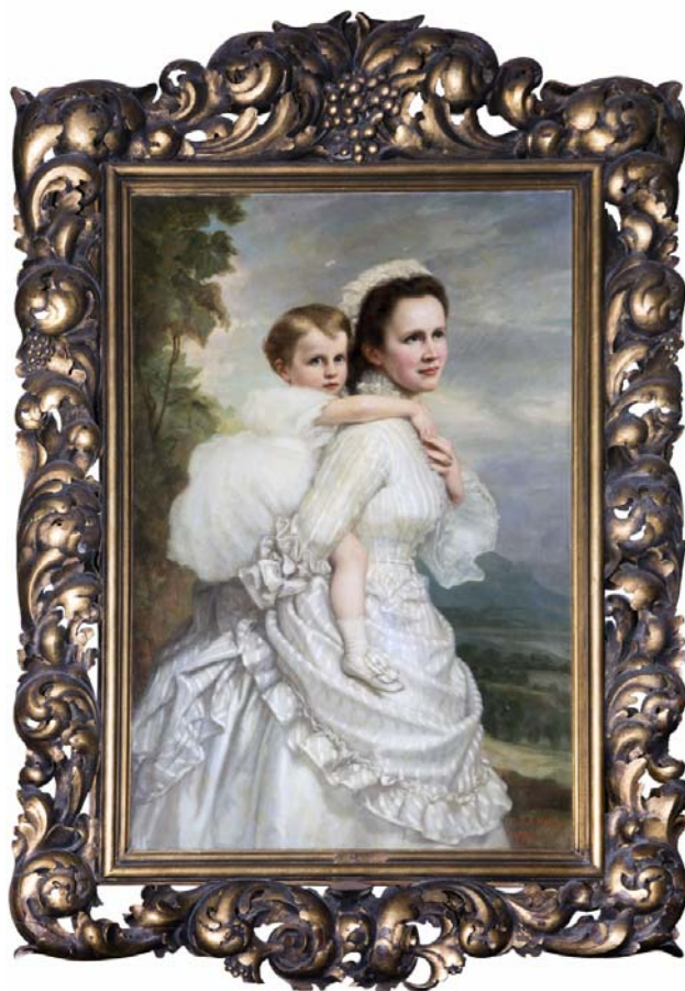
Fig. 7. Principesa Elisabeta cu Principesa Mărioara. Ulei pe pânză. Semnat și datat dreapta jos, cu roșu: „G.P.A. Healy. 1874”. După o fotografie de Franz Duschek, 1872. 140 cm × 92 cm. Nr. inv.: 7287; PS: 189, PS: 202. Muzeul Național Peleş.