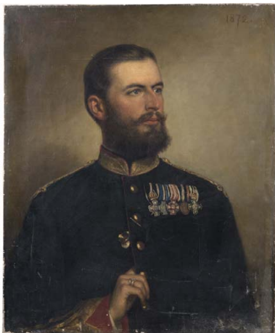
Fig. 5. Principele Carol. Ulei pe pânză. Nesemnat, datat colțul stânga sus cu roșu „1872”. 73 cm × 60 cm. Nr. inv.: 15.555. Muzeul Național Peleş.