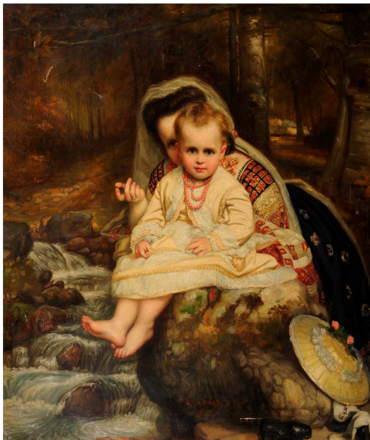
Fig. 4. Princesesa Elisabeta cu Princesesa Mărioara. Ulei pe pânză. Semnat și datat cu roșu, jos, median „G. P. A. Healy. 1872”. 126 cm × 105,5 cm. Nr. inv. 9414 / 1448. Muzeul Național de Artă al României.