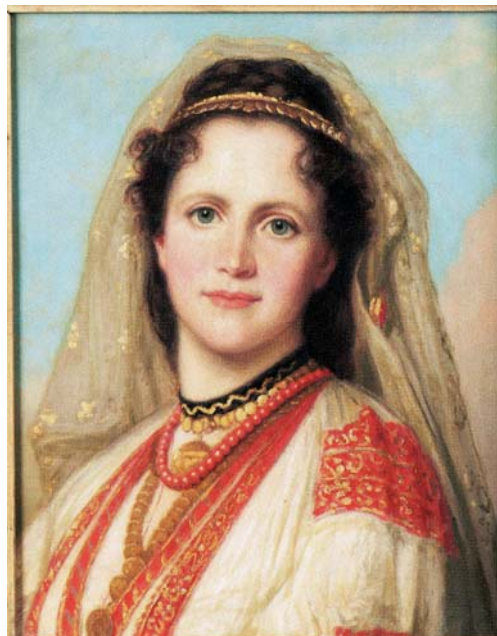
Fig. 2. Principesa Elisabeta. Ulei pe pânză, 1873. Nesemnat, nedatat. 52 cm × 42 cm. Colecție particulară, Germania. Fotografia a fost reprodusă după catalogul expoziției Carmen Sylva. Eine Königin aus Neuwied , Museum. Neuwied, 2016.