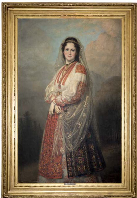
Fig. 1. Principesa Elisabeta în costum popular. Ulei pe pânză. Semnat, datat, localizat dreapta jos, cu roșu: „G.P.A. Healy Pixit. Roma. 1872”. Pe verso, inscripție în lb. română: „Elisabetha Doamna la vârsta de 28 ani. 1872.Roma?”. 140 cm × 92 cm. Nr. inv.: 7300, P: 564, PS. 202. Muzeul Național Peleş.