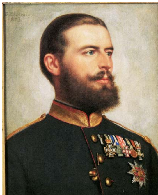
Fig. 6. Principele Carol. Ulei pe pânză. Semnat și datat stânga sus, cu negru: „G. P. A. Healy, 1873”. 52 cm × 42 cm. Colecție particulară din Germania. Fotografia a fost reprodusă după catalogul expoziției Carmen Sylva. Eine Königin aus Neuwied , Museum. Neuwied, 2016.