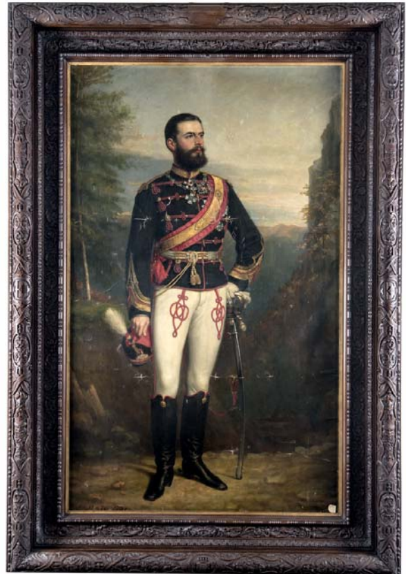
Fig. 10. Regele Carol I în uniformă de călărași. Ulei pe pânză, Semnat și datat stânga jos cu roșu: „G. P: A. Healy.1881”. 180 cm × 125 cm. Nr. inv.: 11643; P: 412, PS: 41. Muzeul Național Peleş. Fotografie realizată de fotograful Muzeului Național Peleş, Udvardi Arpad.