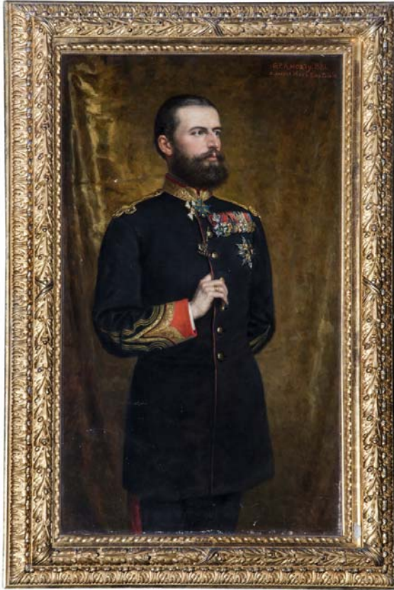
Fig. 9. Regele Carol I. Ulei pe pânză. 140 cm × 80 cm. Semnat, datat și localizat dreapta sus, cu roșu: „G.P.A. Healy. 1881. Bukarest. Mars 5 au Palais?”. Nr. inv.: 7288; P: 562, PS: 190. Muzeul Național Peleş.