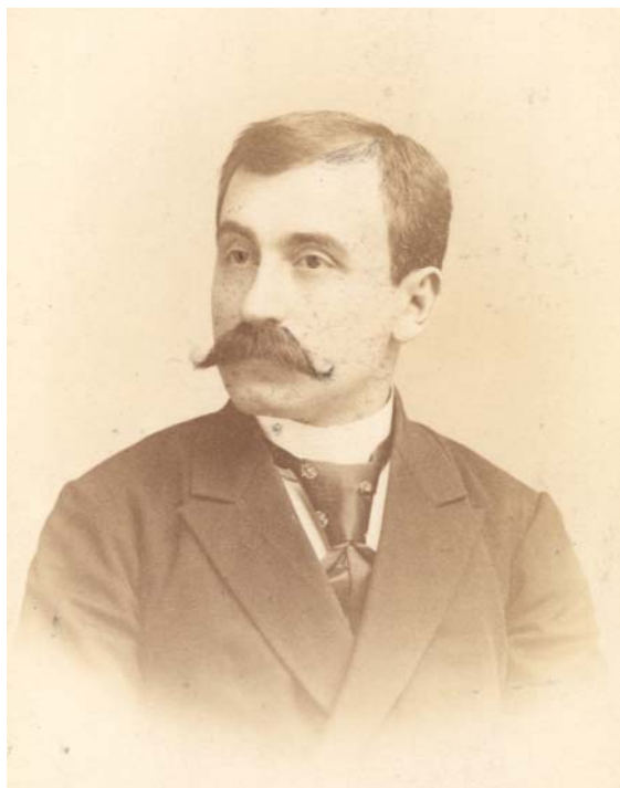
Fig. 4. Pictorul Ion Georgescu, care a fost decorat în 1883 cu clasa I a medaliai Bene Merenti.