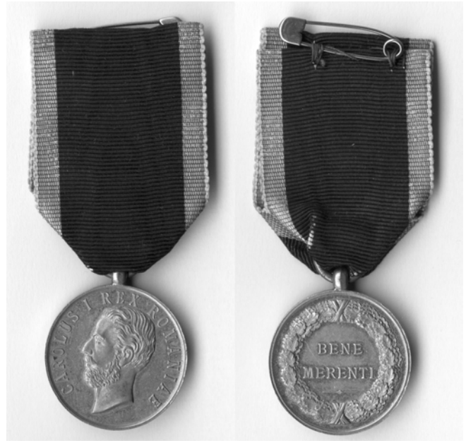
Fig. 2. Medalia Bene Merenti, modelul „Rex”, avers (în stânga) și revers (în dreapta).