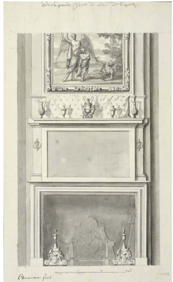
Fig. 15. René Chauveau, Vue de la cheminée avec les bras et les chenets, portant l'inscription « De la Grande Chambre de Made. De Seignelay », signé « Chauveau fecit », Paris, avant 1690, dessin à l'encre et lavis sur papier, Stockholm, Nationalmuseum, inv. THC 2148.