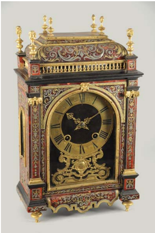
Fig. 4. Louis Baronneau, Pendule religieuse, Paris, vers 1675, marqueterie en première partie en laiton et étain sur fond d'écaïlle rouge, bronze doré, 47 × 28 × 13,5 cm, vente, Cheverny, Me Rouillac, 11 juin 2012, n° 35.

Ensuite, sous les n os 177 et 178 sont décrites, respectivement, « une pendule faite par Baronneau, les heures marquées sur l'email dans sa boeste de marqueterie à colonnes et chapiteaux corinthiens » et « une autre plus grande pendule faite par le mesme Baronneau dans une boeste de marqueterie à pilastre », chacune prisee 200 livres, qui ne manquent pas d'évoquer deux horloges conservées, signées par cet artisan 5 (fig. 4–5).