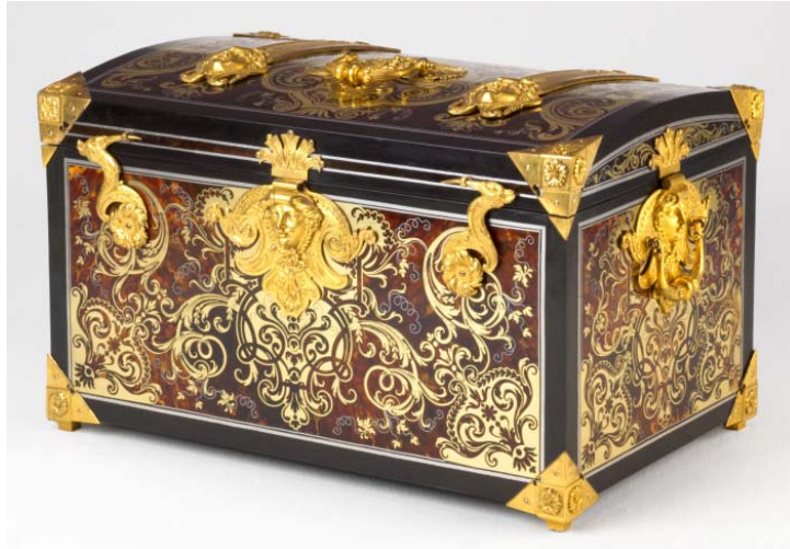
Fig. 7. André-Charles Boule, Coffret, Paris, vers 1690, chêne, marqueterie en première et en seconde partie de laiton, d'étain, sur fond d'écaille, bronze doré, 44,5 × 73 × 48,3 cm, Chicago, Art Institute, inv. 2001.54.

table de marbre violet d'Italie, portée « sur son pied de bois sculpté, doré », qui se trouvait en 1722 8 dans la demeure parisienne de Pierre Gruyn, un autre de ses grands clients. Un dessin du musée des Arts décoratifs de Paris 9 attribué à Boule lui-même ( fig. 8 ) offre une image parlante de ces piétements en bois sculpté très prisés pendant le dernier quart du XVII e siècle. Les plateaux posés sur un pied en triangle ne sont pas sans rappeler le modèle des tables en encoignure exécutées par Boule pour la Ménagerie de Versailles 10 .