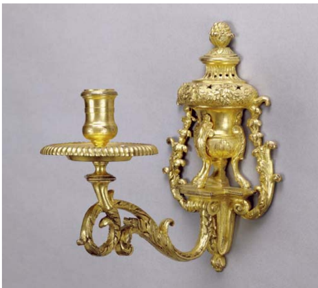
Fig. 16. Domenico Cucci, Bras de lumière pour le cabinet ou la chambre de la marquise de Seignelay, Paris, avant 1690, bronze doré, 21,6x12,7x19,1 cm, Malibu, J. Paul Getty Museum, inv. 2004.67.