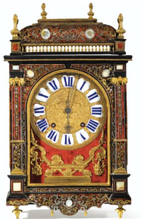
Fig. 5. Louis Baronneau, Pendule religieuse, Paris, vers 1675, marqueterie en première partie en laiton, étain et nacre sur fond d'écaïlle rouge, bronze doré, émail peint, 55 × 31 × 15 cm, Sotheby's, Paris, 9 novembre 2012, n° 46.