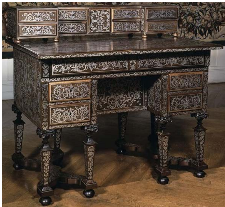
Fig. 2. Anonyme, Bureau brisé à caissons et à gradin, Paris, vers 1670–1675, marqueterie en première partie d'étain sur placage de palissandre, marqueterie de bois de rapport, bois sculpté et doré, Paris, musée de Cluny, inv. CL 20487, en dépôt au musée du Louvre.