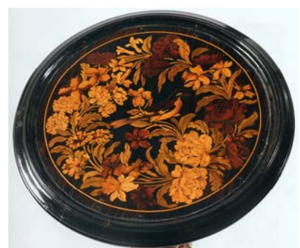
Fig. 9 a-b. Anonyme, Paire de guéridons, Paris, vers 1685–1690, marqueterie de bois de rapport, bois sculpté et doré, 108,5 × 39 cm, Sotheby's, New York, 9 novembre 2006, n° 2.