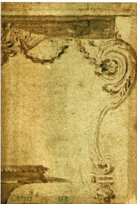
Fig. 8. André-Charles Boule, Projet pour une table-console, vers 1700–1705, encre, plume, lavis sur papier, 23,5 × 54,5 cm, Paris, musée. des Arts décoratifs, inv. 725.