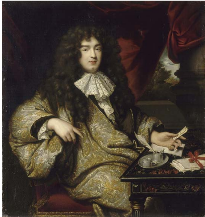
Fig. 1. Jean-Marc Nattier, d'après Claude Lefebvre, Détail de la table de Pierre Gole représentée sur le Portrait de Jean-Baptiste Colbert, marquis de Seignelay , vers 1676, huile sur toile, musée national du château de Versailles et des Trianon, inv. MV 3556.

bois de rapport ». Un bureau en première partie, conservé au musée du Louvre 3 (fig. 2) et un second, en contrepartie 4 (fig. 2–3), peuvent ainsi évoquer l'austère meuble de travail ayant appartenu au marquis puis à sa veuve.