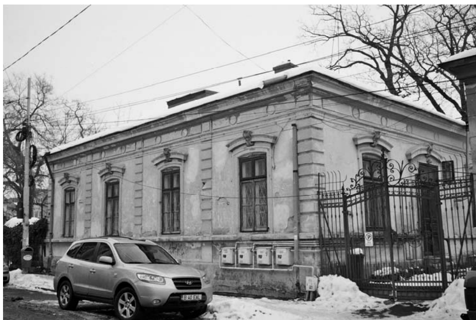
Fig. 4. Casa lui Nicolae Brezianu, București, str. A. D. Xenopol nr. 10, dec. 2012, foto: Mihai Sorin Rădulescu.