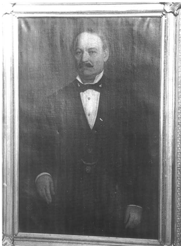
Fig. 3. Pitarul Iancu Brezianu, fotografie la B.A.R., Cabinetul de Stampe, cota 167141, fotografie a tabloului aflat la Muzeul Județean de Artă „Ionescu-Quintus”, Ploiești.

croitorie. Afinitățile familiei Brezianu cu Franța se văd confirmate și de această proximitate topografică cu sediul misiunii ei diplomatice.